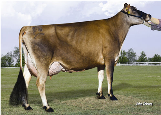
JX FARIA BROTHERS TARGET RONAL DAM