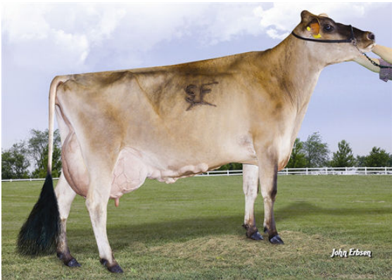
JX FARIA BROTHERS ACTION DEAN SMITH {1} GRANDDAM